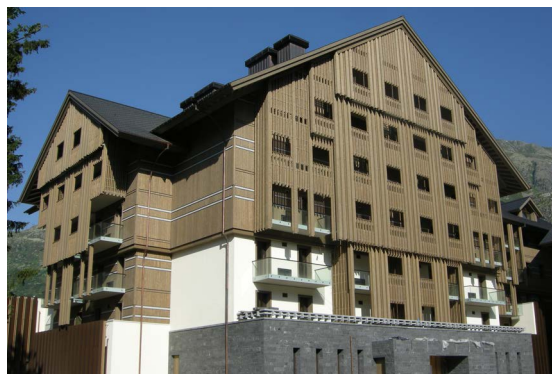
Le Resort Andermatt Swiss Alps est en cours de réalisation à Andermatt. Actuellement, il comprendra environ 500 appartements dans 42 bâtiments, 28 chalets, etc. Il s'y ajoutera six hôtels 4 et 5 étoiles, parmi ceux-ci l'Hôtel 5 étoiles bien connu, The Chedi Andermatt.