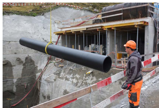
Une station de pompage qui desservira prochainement 200 générateurs de neige sera mise en service à la nouvelle saison hivernale.