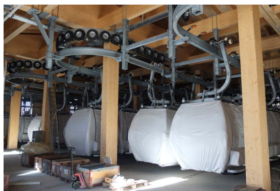
Un paradis à la neige a été créé pour les familles, enfants et randonneurs hivernaux à la nouvelle station intermédiaire de Nätschen - Gütsch et entrera également en service l'hiver prochain, on se trouve aussi le garage des cabines.