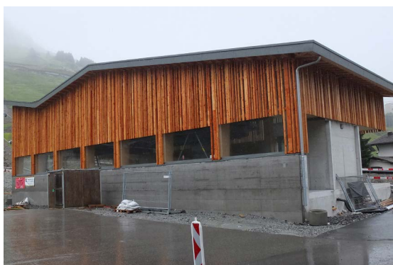
A partir du mois de décembre on parviendra commodément de la gare d'Andermatt au Gütsch avec le nouveau télécabine à 10 places de Garaventa.

On travaille actuellement sur le télécabine Andermatt - Nätschen - Gütsch („Gütsch-Express“), qui conduit, à partir de la gare d'Andermatt, à la nouvelle station intermédiaire de Nätschen doté d'un restaurant („restaurant