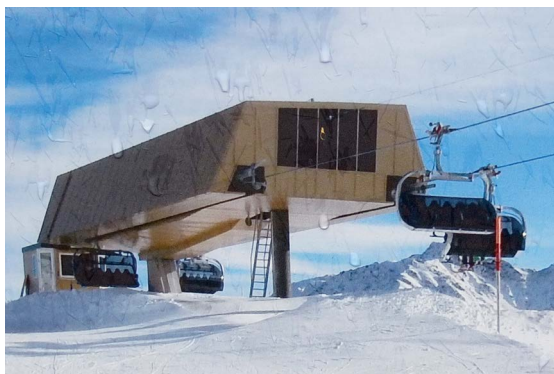
Les trois fabricants internationaux de téléphériques ont été impliqués dans les 10 nouvelles installations de transports à câbles du domaine skiable Andermatt-Sedrun. C'est ainsi que Bartholet (BMF) a réalisé l'année dernière le nouveau télésiège de design Porsche à l'Oberalpass.

du projet a nécessité six ans (2009-2014). Les projets d'exécution ont été examinés et autorisés par l'Office fédéral des transports (OFT) selon une procédure de roulement. Les travaux ont pu commencer à l'échéance du délai d'oppositions légal. Cette procédure d'autorisation globale en deux parties complexes et exigences du temps a été appliquée pour la première fois en Suisse. L'Andermatt-Sedrun Sport AG a dans ce cadre été assistée par un groupe d'accompagnement, dans lequel sont représentés les organisations environnementales, la Confédération et les cantons, de même que la bourgeoisie d'Uri. Cette nouvelle procédure intégrée garantit la sécurité de la planification pour la réalisation du concept global et permet une procédure mutuellement adaptée de la Confédération, du canton et des communes.