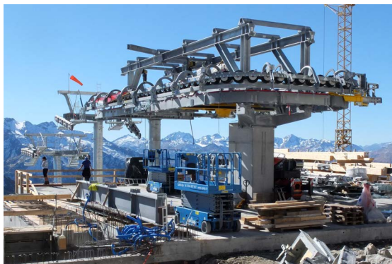
La station supérieure "Schneehüenerstock" sera accessible durant la saison hivernale 2018/19 par un télécabine du col de l'Oberalp.