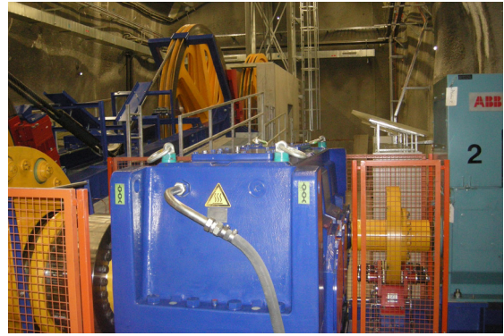
L'entraînement du funiculaire est disposé dans une caverne séparée en dessous de la station d'altitude.

de pouvoir visiter la toute dernière digue d'accumulation, la plus élevée d'Europe et la plus longue de Suisse. On est ensuite revenu à la station inférieure de la seconde section d'Ochsenstäfeli, d'où on a été conduit par des bus à la nouvelle grande caverne souterraine. De là, on est ensuite parvenu à la station inférieure avec le funiculaire lourd à Tierfehd. Le cercle de cette visite très intéressante a ainsi été fermé.