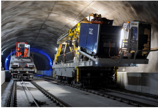
Malgré une apparence particulièrement simple, les deux véhicules sont équipés d'une technique pour téléphériques ultramoderne.