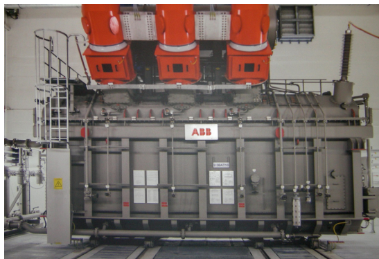
Un des quatre transformateurs de 190 tonnes qui ont été transportés avec le funiculaire dans la centrale de la caverne.

avec un train de roulement de 16 rouleaux conjointement avec un autre de 24 rouleaux. Deux suspensions sont fixées sur le second train de roulement, lesquelles sont conçues pour une charge de 12,5 tonnes. Sous les suspensions sont disposés des élévateurs atteignant une hauteur de course de 30 m. Ces élévateurs sont équipés d'un treuil et sont entraînés hydrauliquement. La voie 2 est équipée des mêmes trains de roulement que la voie 1, cependant sans cabine. Les importantes dimensions des téléphériques apparaissent en accédant à la cabine qui n'est atteinte qu'après avoir franchi 150 marches. Cette impression commence déjà en passant à côté des grandes poulies de 6 m dans l'imposant bâtiment de la station aval. Le poids de tension du câble de traction y est d'autre part disposé. La station aval est conçue sous la forme d'une construction métallique. Les forces de câbles sont dirigées dans le sous-sol au moyen de fondations massives en béton ainsi que d'ancrages dans la roche. Le train de roulement pourvu de 24 rouleaux sur des câbles porteurs d'une épaisseur de 90 mm surprend. On atteint la cabine de Gangloff par un escalier qui suit la selle de la station. Les passagers parviennent dans la cabine par un quai latéral.