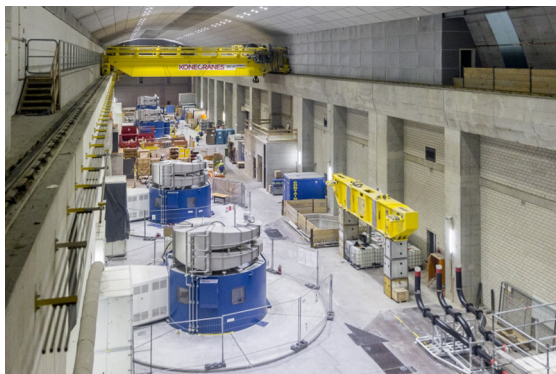
Les turbines de pompage et les génératrices à moteur sont logées dans la caverne des machines d'une longueur de presque 150 mètres.