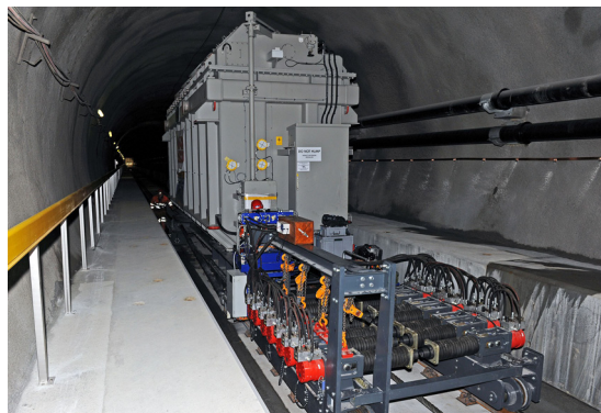
Des transports spéciaux atteignant 215 tonnes ont été réalisés avec le funiculaire lourd.

lourds de la centrale, à partir de 80 tonnes, un train de roulement supplémentaire est monté sur le véhicule de transport de charges. Tous les transports lourds sont chargés à l'extérieur de la galerie du tunnel dans la zone d'entrée et parviennent, par une galerie horizontale et des plates-formes de révision basculables, sur la voie inclinée. De manière à assurer le transfert dans la galerie horizontale, les véhicules sont séparés du câble et déplacés par un véhicule de traction (par ex. un camion). Un des véhicules est équipé d'une tête d'extrémité de câble, de manière à pouvoir réaliser rapidement et en toute sécurité le processus de séparation du câble. L'accrochage et le décrochage de la douille de câble lourde s'effectuent à l'aide d'un dispositif de levage réglable. Les deux véhicules du nouveau funiculaire sont, malgré leur apparence particulièrement simple, d'une technique ultramoderne. Ils possèdent de tout nouveaux bogies nouvellement développés d'un diamètre de roue de 750 mm et quatre pinces de freins-parachutes intégrées d'une force de freinage unitaire de 90 kN.