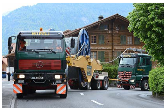
Le transport des deux nouveaux câbles de la nouvelle télécabine Grindelwald-Männlichen est intervenu de nuit entre Wilderswil et Grindelwald.

viron CHF 60 millions. Le projet V-Bahn comporte huit éléments d'investissement: du point de vue technique du transport à câble, le remplacement de la télécabine «Grindelwald-Männlichen» et de l'«Eigerexpress» constitue l'investissement le plus spectaculaire. Cependant, la modernisation du Berner Oberland-Bahn avec six nouvelles rames de traction et trois voitures de traction à plancher surbaissé, de même que la construction du nouveau terminal «Grindelwald Grund»