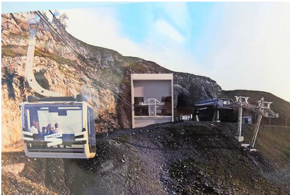
La station d'altitude du nouveau téléphérique 3S «Eigerexpress», reliée par un tunnel au nouveau terminal couvert du Jungfrau-bahn sur la face sud, est édifiée sur la face nord derrière la station d'altitude du télésiège.

Grindelwald sur les stations inférieures, même l'enlèvement des roches du glacier de l'Eiger a été poursuivi pour l'élargissement de la station du Jungfrau-bahn et pour la nouvelle construction de la station d'altitude «Eigerexpress» malgré le froid et la neige. La station du glacier de l'Eiger a un tout nouveau visage: la station d'altitude du nouveau téléphérique 3S «Eigerexpress», relié par un tunnel au nouveau terminal couvert du Jungfrau-bahn sur la face sud voit le jour sur la face nord derrière la station d'altitude du télésiège de la paroi nord de l'Eiger. À l'avenir, les visiteurs changeront de téléphérique dans le Jungfrau-bahn. Actuellement y est réalisée la construction brute du bâtiment de la station qui doit être terminée d'ici cet automne. Les deux lignes de chemin de fer existantes du Wengernalpbahn à partir de Grindelwald et de Lauterbrunnen à la Kleine Scheidegg continueront également à l'avenir à être exploitées par les Jungfrau-bahnen.