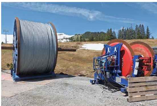
Le câble d'entraînement de Fatzer est déjà prêt à être tiré pour les deux sections Holenstein - Männlichen.

part, trois des sept pylônes ont été réalisés sur le tronçon de l'«Eigerexpress». Un téléphérique de matériel a été édifié de Zingrich à partir de Salzegg jusqu'au glacier de l'Eiger pour assurer un transport optimal du matériel de la station d'altitude du nouveau téléphérique 3S à la station du glacier de l'Eiger. Le premier transport lourd spectaculaire du V-Bahn est intervenu le 18 décembre 2018. Un nouveau transformateur pour l'alimentation en courant à partir de Grindelwald, d'un poids de 42 tonnes a été livré. Ce transformateur a été disposé dans le sous-sol de la future station inférieure du téléphérique Männlichen et a pu être mis sous tension au printemps 2019. Les travaux ont été poursuivis à