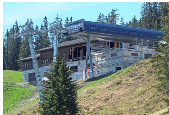
Les stations du nouveau télécabine 10 D-Line «Grindelwald-Männlichen» sont déjà construites.