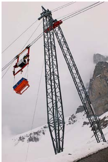
Le transport du matériel du nouveau téléphérique 3S est assuré à partir de Salzegg par un téléphérique de matériel de Zingrich.