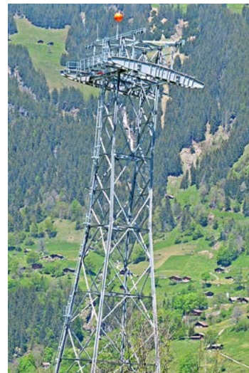
Trois des sept pylônes de l'«Eigerexpress» ont déjà été réalisés l'année dernière.

avec différents commerces et parkings, mais également la modernisation du matériel roulant du Wengeralpbahn, de même que du Jungfraubahn et la liaison directe au Firstseilbahn ne sont pas moins spectaculaires que la construction de ces deux nouveaux téléphériques performants.