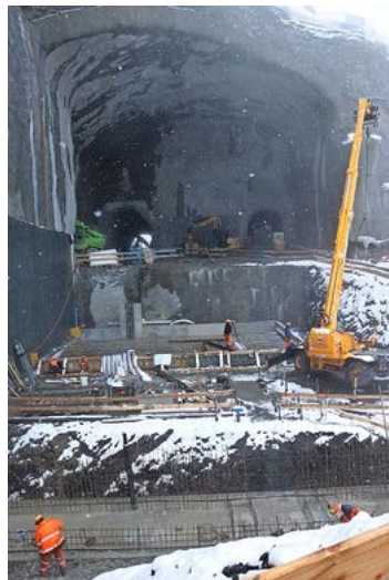
La nouvelle station de correspondance au Jungfraubahn voit le jour à la station «Eigergletscher» à 2'320 m d'altitude.