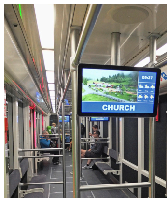
Le véhicule proprement dit est constitué par une rame en trois parties,

de passagers pendant au total 46'750 heures d'exploitation. Ce faisant, nous avons littéralement fait 25 fois le tour de la terre et parcouru avec l'ancien métro presque un million de kilomètres. Nous souhaitons que le nouveau assure un transport tout aussi impressionnant et sans accident de nos hôtes, visiteurs et, naturellement, de tous les habitants de Serfaus.