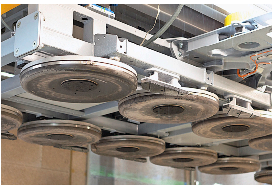
La solution reposant sur coussins d'air garantit un confort de transport pratiquement silencieux.

Le métro automatique a d'autre part bénéficié d'un nouveau look complet. Les touristes, tout comme les habitants ont pu dans un concours présenter leur projet de nouveau métro à coussin d'air. Le jury a opté pour le concept