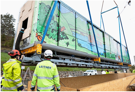
Un travail de précision a été exigé lors du lavage des véhicules.