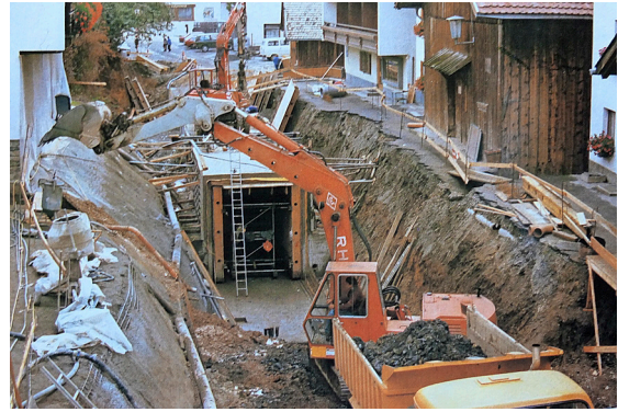
Une entreprise courageuse, lorsqu'en 1984 un tunnel en béton traversant le village a été construit pour un métro à Serfaus.

45 mètres. La rame est d'environ 15 mètres supérieure, de même que cinquante centimètres plus haute et également plus large. Et néanmoins chaque wagon pèse une demie tonne de moins que le modèle précédent. Equipé d'un nouveau système d'information et de maintenance, il offre naturellement tous les agréments dont a besoin un moyen de transport moderne. Des possibilités d'accès et de sortie pour fauteuils roulants et poussettes d'enfants, de même que des portes d'accès plus larges et la possibilité de parcourir la totalité de la rame veillent à une absence d'obstacles. La capacité de transport a également été optimisée: «Avec une capacité de 3'000 personnes/heure, celle d'environ 1'600 passagers a presque été doublée. Les intervalles ont été réduits à neuf minutes et en conséquence le confort des passagers a été nettement accru», expliquent Stefan Mangott et Georg Geiger.