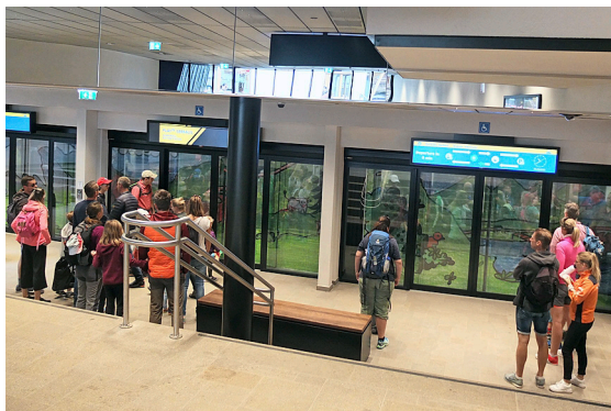
Les nouvelles stations se présentent de façon moderne, sans obstacles et compatibles avec les poussettes.