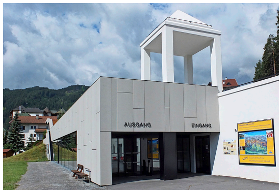
Les passagers atteignent avec le train à coussin d'air tous les lieux importants du village

d'un jeune de Basse Autriche qui, depuis son enfance, passe régulièrement ses vacances à Serfaus. On peut maintenant voir sur le nouveau métro la mascotte de Serfaus, les «Marmottes» dans différentes activités estivales et hivernales. Il est également fait appel sur les stations aux passagers les plus jeunes: les nouveaux contes ont été récités par des enfants, ainsi chaque jour un autre «compagnon du wagon du jour» annonce la station prochaine en allemand et en anglais.